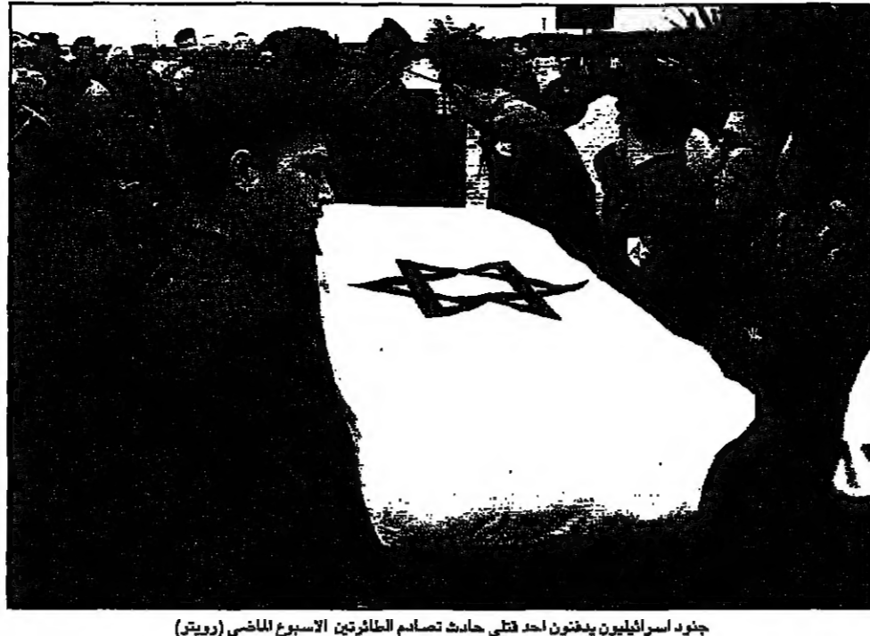
جنود الاسرائيليين يفتشون احد قتلى حادث تصادم الطائرات الاسبوع الماضي

دخول اسرائيل الى الانسحاب من لبنان بعد الحادث قاتلا ان ما حدث الطائرتين سيحزن النقاش الداخلي حول وجود القوات الاسرائيلية في لبنان واستمرار الازمة المطالبة بالانسحاب لكن لا فاعلة. انها مستمك من ان تكون فاعلة. وكان ثواب من اعطاء لجنة الدفاع الخارجية في الكنيست الاسرائيلية قد اعطوا بعد الحادث انهم يعتزمون طرح موضوع «الشريط الامني» الذي تحتكم اسرائيل في جنوب لبنان من المناقشة. كذلك صرح جديعون عزرا من كتلة ثواب حزب الليكود ان الوجود العسكري الاسرائيلي في لبنان ليس له اي جدوى ولذلك لا يدان من سحب قواها. ومن القدس استبعد السفير الفرنسي في جنوب لبنان في حال قوت اسرائيل من جانب واحد وسحب قواتها من هناك، معتبرا ان خطوة من هذا النوع لن تنجح ما لم تتوافق مع اتفاق مع سورية ينص على انسحاب من هضبة الجولان التي احتلتها الدولة العبرية في العام 1967. وقال وزير الدفاع في وزارة الدفاع والشمس في بيان له ان اسرائيل لن تنسحب من لبنان في حال قوت اسرائيل من جانب واحد وسحب قواتها من هناك، معتبرا ان خطوة من هذا النوع لن تنجح ما لم تتوافق مع اتفاق مع سورية ينص على انسحاب من هضبة الجولان التي احتلتها الدولة العبرية في العام 1967. وقال وزير الدفاع والشمس في بيان له ان اسرائيل لن تنسحب من لبنان في حال قوت اسرائيل من جانب واحد وسحب قواتها من هناك، معتبرا ان خطوة من هذا النوع لن تنجح ما لم تتوافق مع اتفاق مع سورية ينص على انسحاب من هضبة الجولان التي احتلتها الدولة العبرية في العام 1967.